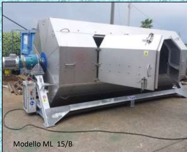
Modello ML 15/B