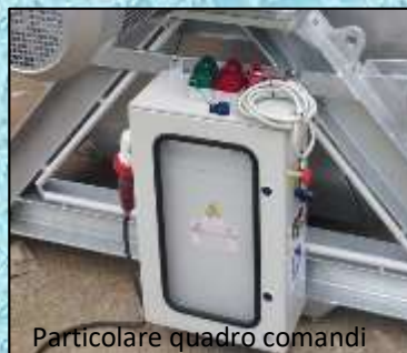
Particolare quadro comandi

Su richiesta possono essere realizzate macchine personalizzate con capacità fino a 30 – 40 MC.