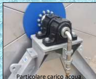
Particolare carico acqua

Tutte le Macchine Lavareti Mod. ML rispondono alla vigente Normativa Macchine e vengono fornite corredate di Targa Identificativa munite di Manuale Uso e Manutenzione completo di Marcatura CE