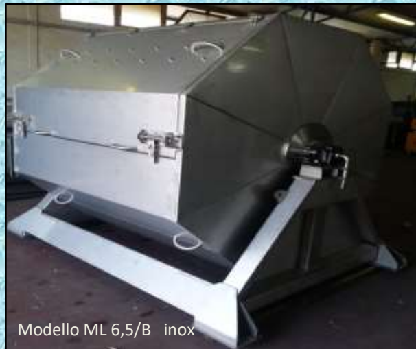
Modello ML 6,5/B inox

Tutte le altre caratteristiche corrispondono a quelle del modello ML/A